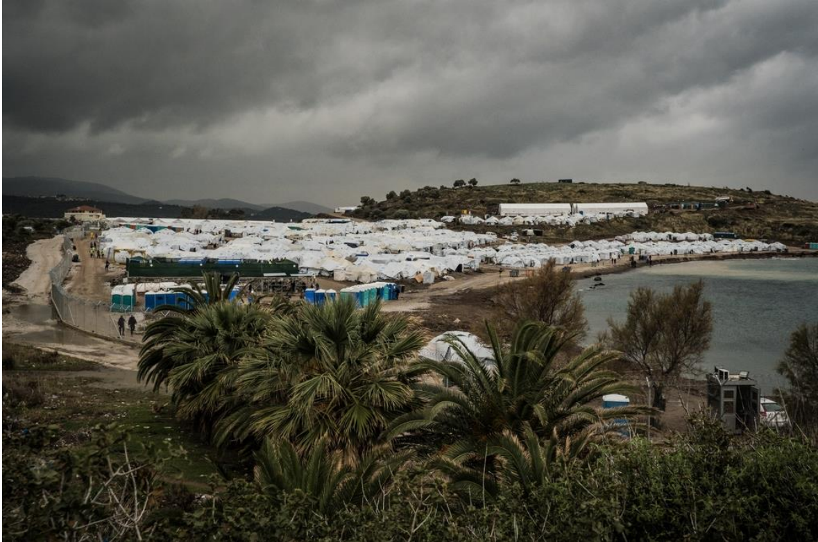
Foto: Het nieuwe kamp Moria